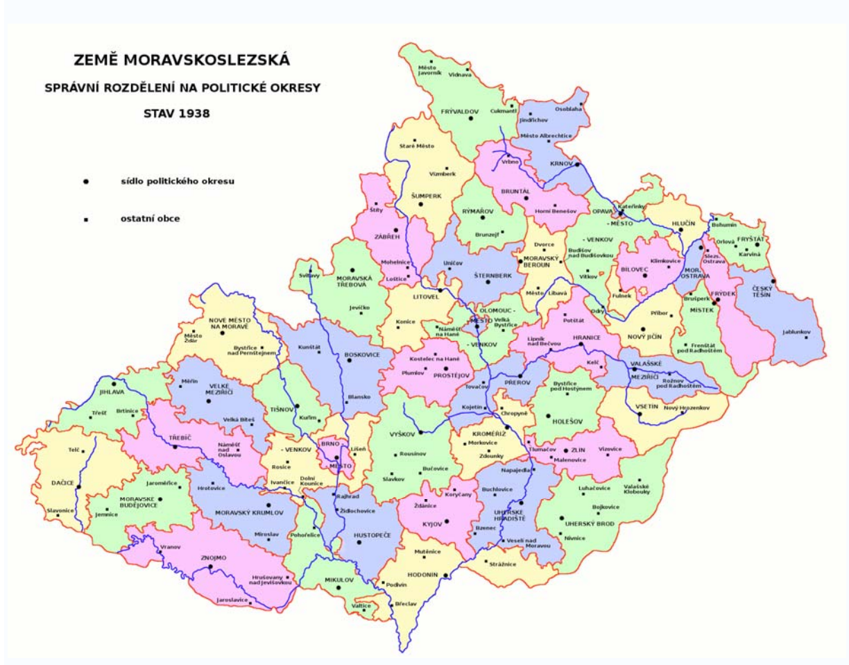
Obr. 2: Správní členění země Moravskoslezské v letech 1928 – 1938

výbory však byly ke dni 9. prosince 1918 zrušeny. Na druhé straně byla koncem roku 1918 na severu ve Slezsku ustavena německá provincie Sudetenland (od Javornického výběžku až po Ostravu – 6.534 km 2 ), na jihu Moravy pak Deutschsüdmähren (1.840 km 2 ).