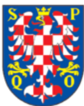
Současný erb města Olomouc (od r. 1996)

Po vzniku Republiky československé se město Olomouc v rámci očisty od všeho rakouského tohoto privilegia v roce 1934 vzdalo (viz Buben, Milan, Heraldik, Albatros, Praha, 1987).