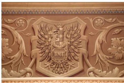
historický znak Olomouce ve Sněmovním sále Moravské zemské sněmovny (dnes Ústavní soud v Brně)

pruským vojskům vedeným králem Friedrichem II. Bílo-červené šachování bylo později nahrazeno za žluto-červené.