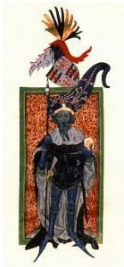
Král Jošt Moravský a Lucemburský

Čech jako dvoustatí. Byl to skutečný počátek nového státoprávního vztahu Moravy a Čech jako dvou svébytných rovnocenných útvarů – ranně středověkých historických zemí. Prvním moravským markrabětem se stal úřední znojenský kníže Konrád II. Ota (* asi 1141; † 9. září 1191 u Neapole). Markrabětem moravským byl od r. 1182–1189 (necelé dva roky před svou smrtí byl navíc zvolen českým knížetem od 1189–1191) a ovládnutím všech moravských přemyslovských úředů spojil pod svou vládou celou Moravu. Jako svrchovaný vládce Moravy se navenek prezentoval moravským erbem a jemu analogickým bojovým praporem.